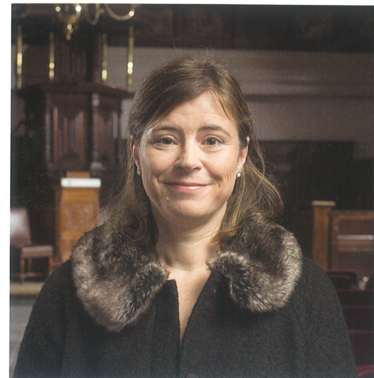
‘Het gaat niet goed met het protestantisme hier. De kerken raken leger’

Er hangt een sfeer van nostalgie rond de herdenkingen van het begin van de Reformatie in Duitsland, merkt Kunter. ‘Het gaat niet goed met het protestantisme hier. De kerken raken leger en leger. Nu bestaat er de gelegenheid om met een zekere weemoed terug te blikken op een protestantse glorieperiode. En toeristen te lokken naar de streek in Oost-Duitsland waar Luther actief was. De kans is klein dat over een eeuw de herdenking even massaal zal zijn. Zeker de staat zal dan meer afstand betrachten.’